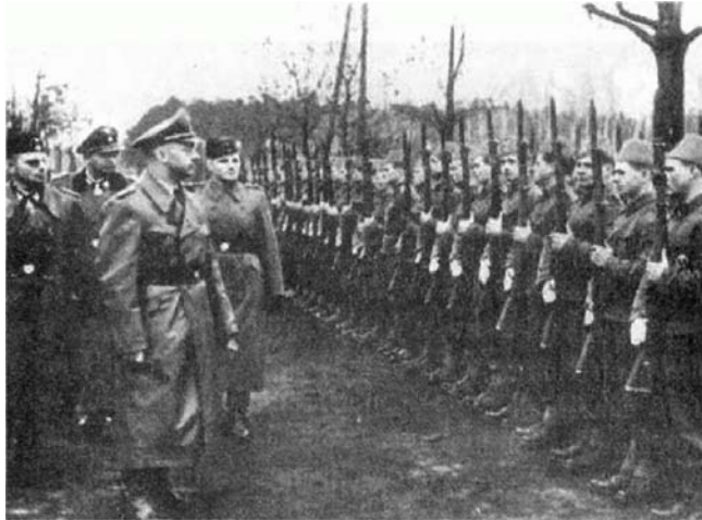
2 Himmler passant en revue la division Handzar.

Cependant, le ministère américain des Affaires étrangères étouffa l'affaire et autorisa les nazis à demeurer aux États-Unis jusqu'à ce que je sois assez stupide pour rendre leur existence publique.