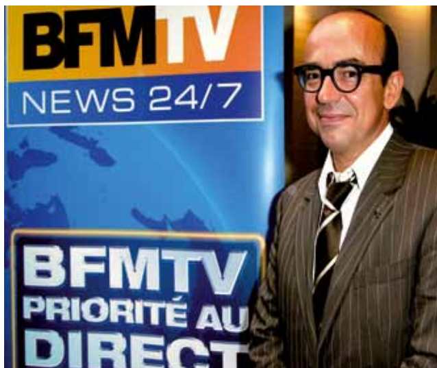
Karl Zéro anime Sarko Info et Zéro Info sur BFM TV.